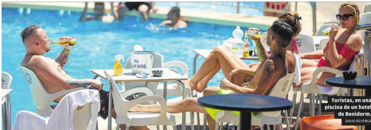
Turistas, en una piscina de un hotel de Benidorm.